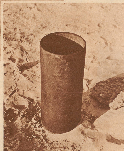
Das Rohr des heute völlig versiegten artesischen Brunnens von Sidi Rasched. Einsam steht es heute im gelben heißen Wüstensand, und in kurzer Zeit wird es unter einer Wanderdüne verschwunden sein.

Le puits est tari. La palmeraie de Sidi Rasched, à 20 kilomètres de Touggourt, est perdue. Les milliers de palmiers, le village que l'on pouvait admirer ici, il y a une vingtaine d'années, ont aujourd'hui l'aspect d'une forêt ravagée par un bombardement de trois jours consécutifs.