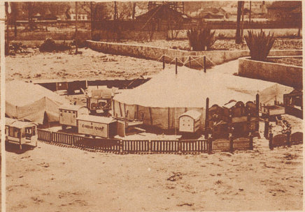
Der Zirkus ist fertig. Auch der Gartenhag ist nicht vergessen worden, der die zu Neugierigen fernhält. Was fehlt, sind nur noch die wirklich lebenden Menschen und Tiere, die der Knabe leider nicht in verkleinertem Maßstabe herbeizaubern konnte.