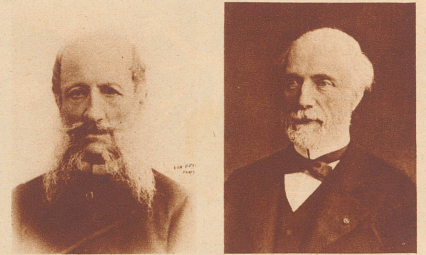
Baron Mohrenheim (links) und Ministerpräsident Freycinet (rechts), zwischen denen im August 1891 der geheime Briefwechsel stattfand, der dann zum russisch-französischen Bündnisvertrag führte.

Felix Faure, dem Präsidenten der französischen Republik, werden in Petersburg die Vertreter der russischen Generalität vorgestellt. 1897. Présentation des officiers supérieurs de l'Etat-Major au Président de la République Félix Faure.