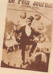
Des français et anglais à l'entente cordiale. Ce n'est pas un accord de paix, mais une déclaration de guerre. Cette campagne de presse et de propagande est une violente campagne de presse et de propagande. Cette campagne d'être à la tête de l'Angleterre. Cette campagne montra le chef du bloc des grandes puissances avec les forces britanniques.