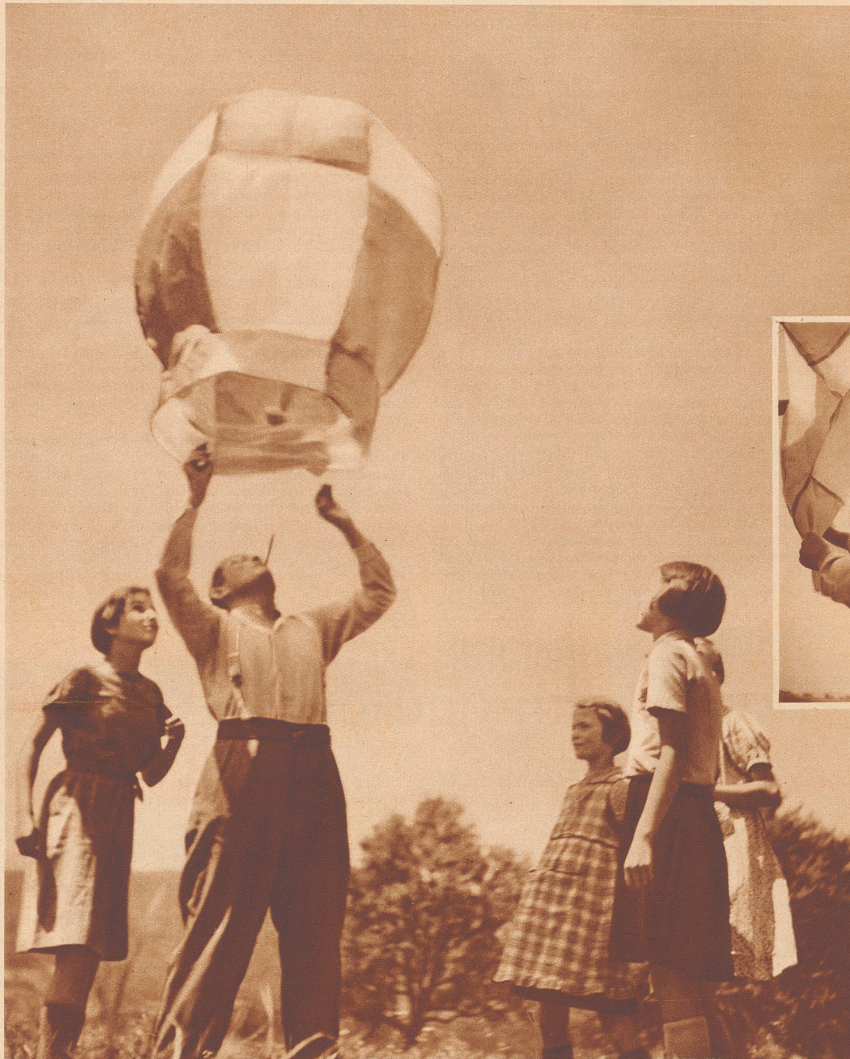
Start des Heißluftballons auf Nimmerwiedersehen!