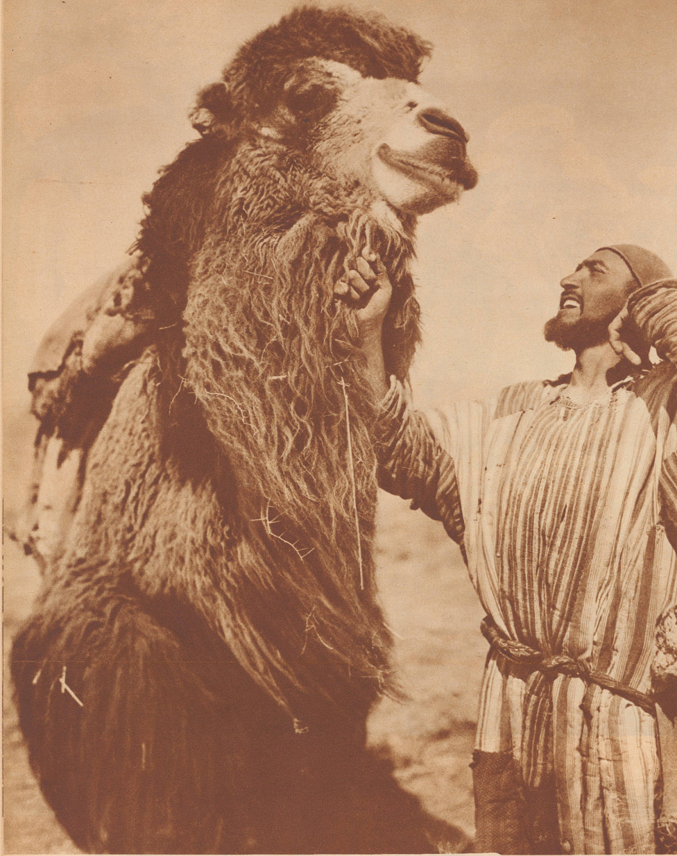
In Turkmenistan. — Au Turkmenistan.