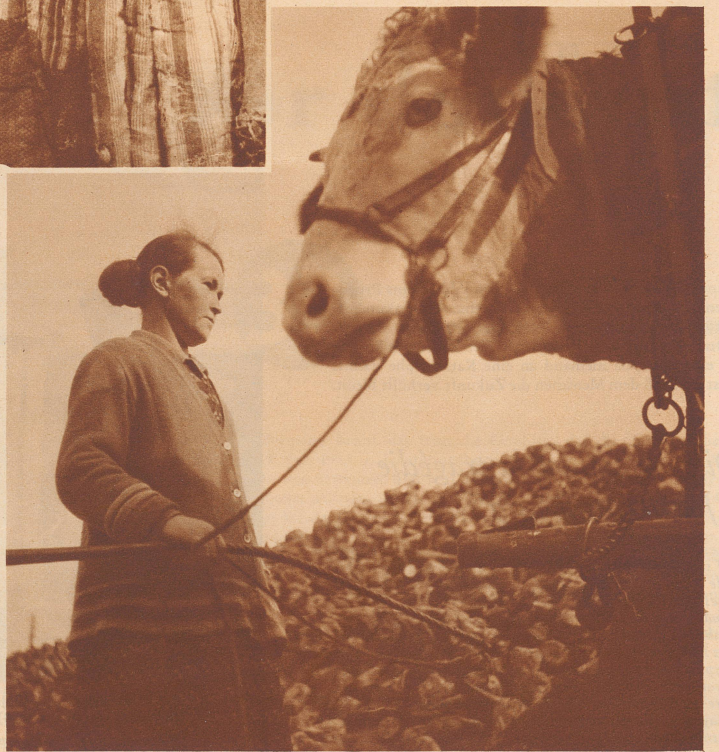
In Aarberg im Berner Seeland, zur Zeit der Rüben- ernte.