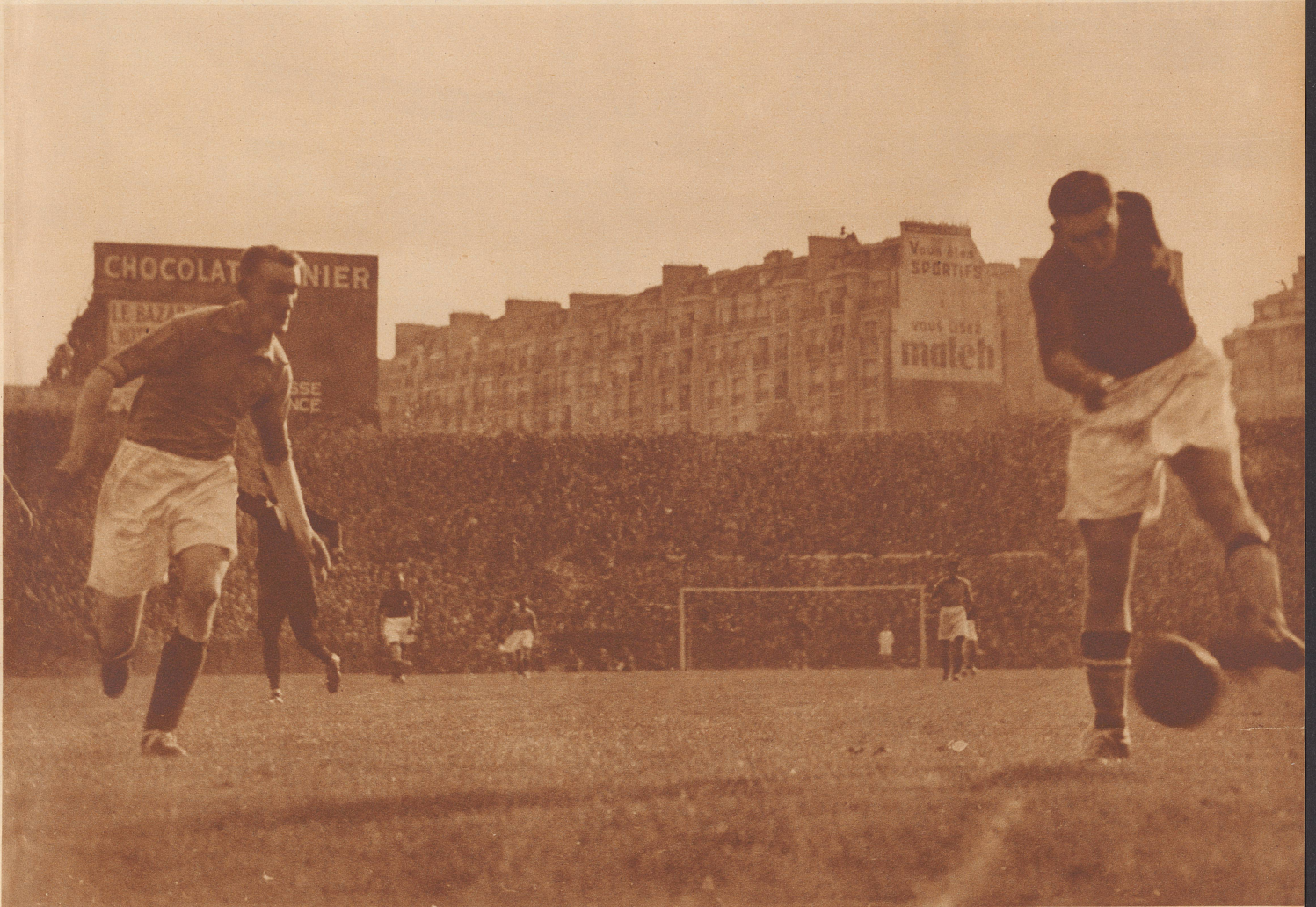
Fünzigtausend Zuschauer im Parc des Princes. Eine graue Masse, sitzen sie da, kaum zu unterscheiden von den Felswänden des riesigen Häuserblocks im Hintergrund. Dazu die riesigen Plakatschriften, die Arena im Vordergrund: Sport unserer Zeit. Match France-Suisse, au Parc des Princes, à Paris: 2:1. 50 000 personnes assistèrent à cette compétition. Notre photo donne une idée de l'énorme affluence.