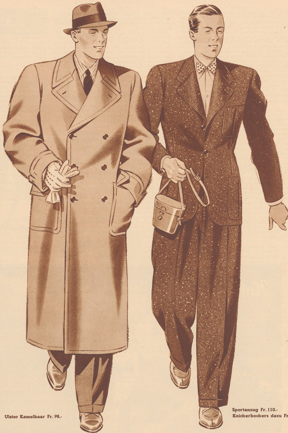
Ulster Kamelhaar Fr. 98.-