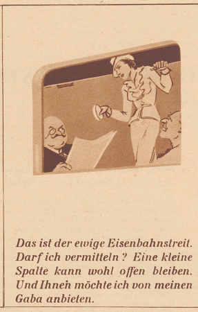
Das ist der ewige Eisenbahntreit. Darf ich vermitteln? Eine kleine Spalte kann wohl offen bleiben. Und Ihnen möchte ich von meinen Gaba anbieten.