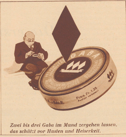
Zwei bis drei Gaba im Mund zergehen lassen, das schützt vor Husten und Heiserkeit.