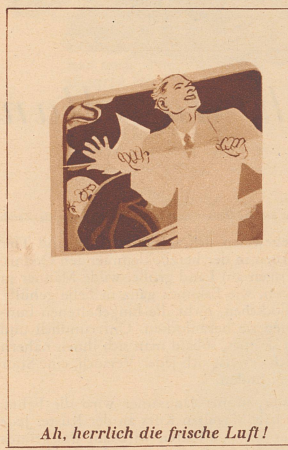
Ah, herrlich die frische Luft!

Was für Zeiten liegen vor uns? Wird man vielleicht eines Tages im Inseratenteil eine «reformierte» Heiratsannonce lesen: «Eleganter Stickstoffler, Mitte Dreißig, ersehnt Eheglück mit liebevoller Natriumblondine. Witwe mit Eisenkind bevorzugt!»