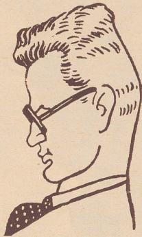
Michael M. Botwinnik