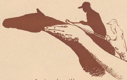
Le jeu des silhouettes.