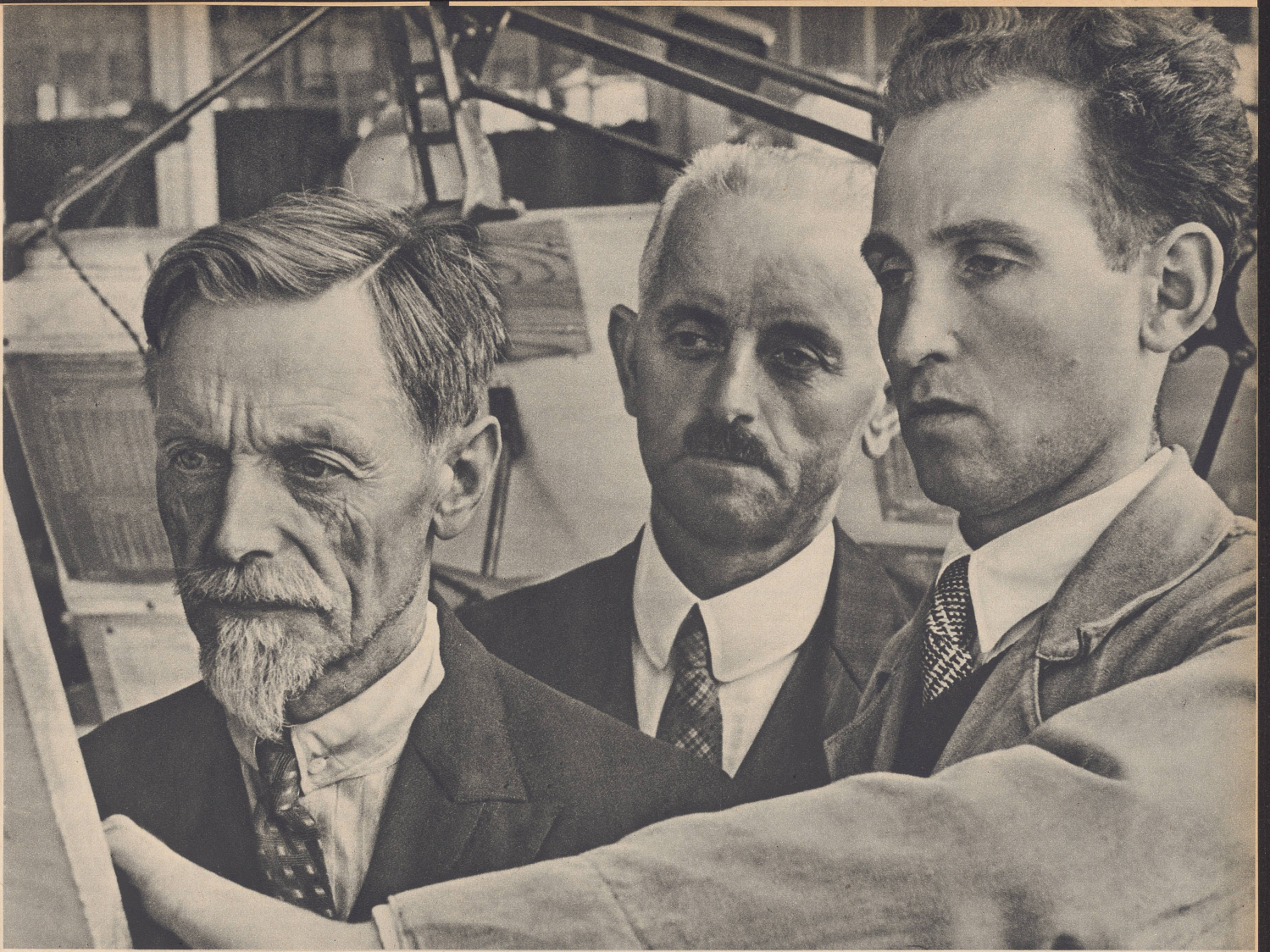
Erfinderische Köpfe in Wissenschaft und Technik forschen über die Lösung von Alltagsaufgaben hinaus nach allgemeinen Erkenntnissen, die für die Bedürfnisse unserer Landesverteidigung und die kriegswirtschaftliche Vorsorge ausschlaggebende Bedeutung erlangen können. Bild: Ingenieure dreier Generationen in der Forschungsabteilung einer schweizerischen Maschinenfabrik. Trois générations d'ingénieurs. Recherches et inventions de nos savants parent dans une certaine mesure à notre disette de matières premières.