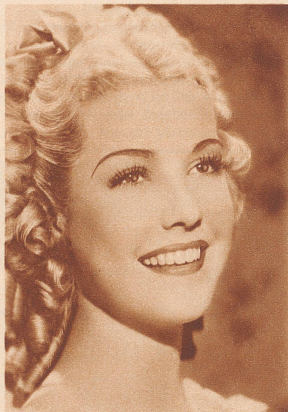
Anita Louise, Star of Warner Brothers Pictures, appearing in „The Go-Getter“.