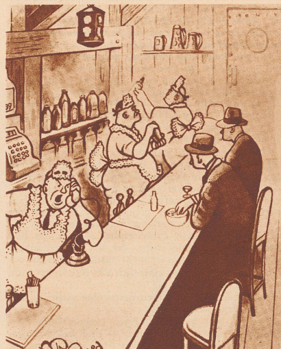
«Verflucht und zugenäht! Wenn Sie uns noch einmal die falsche Wäsche liefern, ist es aus!» — Dites donc! dites donc! attendez que je vous y reprenne! Votre employé nous a de nouveau livré une lessive qui n'est pas nôtre.

— Il y a deux ans, que je n'ai pas parlé à ma femme. — Mais pourquoi cela? — Pour ne pas l'interrompre!