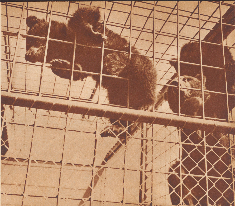
Wenn sie nicht gerade schlafen oder fressen, klettern die drei jungen Bärlü im Zürcher Zoo leidenschaftlich gerne die Gitter hinauf.

Ein «Neffe» oder eine «Nichte» hat dem Unggle Redaktor diese Verse eingeschickt.