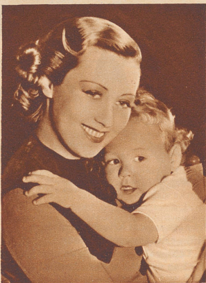
Joan Blondell and her Son Warner Brothers Star appearing in "The perfect Specimen"

IRIUM gibt Ihren Zähnen wieder strahlenden Glanz