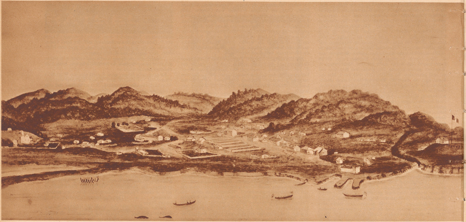
Der Fischerhafen Monterey in Kalifornien, wie er um 1840 herum aussah. Die Ortschaft war damals, als Sutter auf dem Meerwege die amerikanische Westküste erstmals berührte, spanische Missionsstation und blieb bis 1846 kalifornischer Regierungssitz. Heute ist Monterey ein vielbesuchtes Seebad.