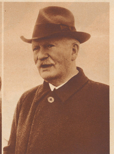
Geheimrat Karl Brandi