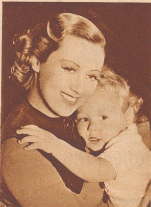
Joan Blondell and her Son Warner Brothers Star appearing in "The Perfect Specimen"

Eine Sammlung erstklassiger Schachpartien aus dem Jahre 1937 erschien soeben im Ungarischen Schachverlag: «Magyar Sakkvillág, Kecskemet» unter dem Titel: «Lieder ohne Worte». Buchpreis Goldmark 1.—. Die Auslese aus 27 Turnieren, sowie einige Match- und Fernpartien wird auch den Kenner zufriedenstellen. Dem Theoretiker wird eine Fülle von Neuerungen geboten.