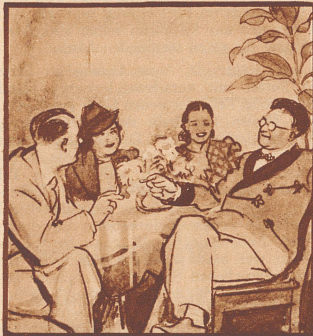
„Und wir haben gehört, daß Sie zum Dirigenten des Gesangvereins gewählt wurden, da dürfen wir noch sehr gratulieren ...“