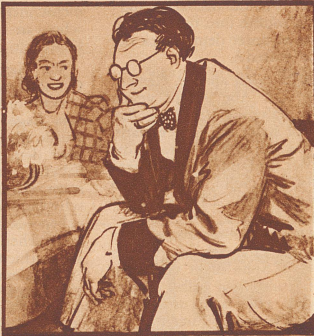
„Hm... vorläufig habe ich noch keine große Freude an dem Chor, nichts als Husten und Räuspern, wir werden ihn umlaufen in „Der heisere Fasan“.“