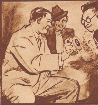
„Sie sollten Gaba verteilen vor dem Singen.“ „Ach, natürlich... daß ich daran nicht selbst gedacht habe!“