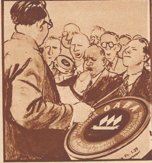
„Meine Herren, denken Sie an den Spruch: Ein kluger Sänger Gaba nimmt, damit es mit der Stimme stimmt.“