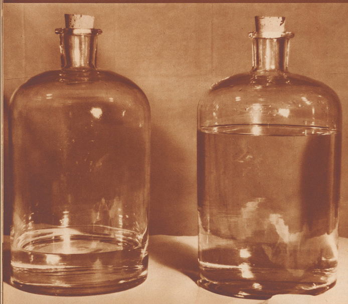
Aufnahmen aus dem Chemischen Laboratorium der Stadt Zürich

La chimie moderne contre les contrefacteurs d'alcools