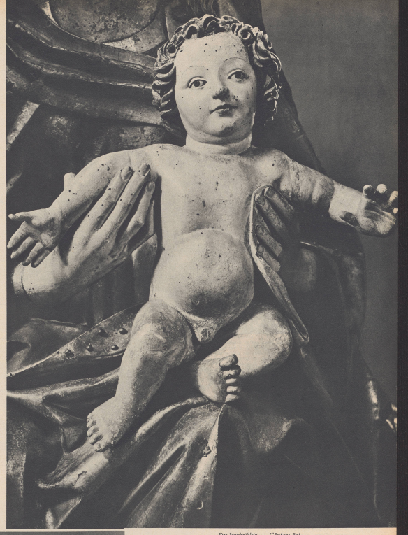
Das Jesuskindlein. — L'Enfant-Roi.