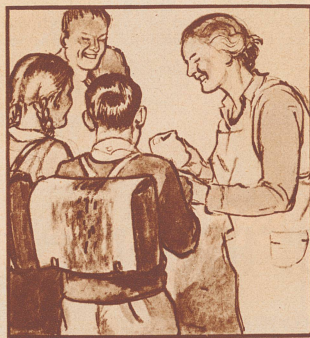
Sie sorgt dafür, daß jeder sein „Znüni“ mitbekommt, aber das ist noch nicht alles...