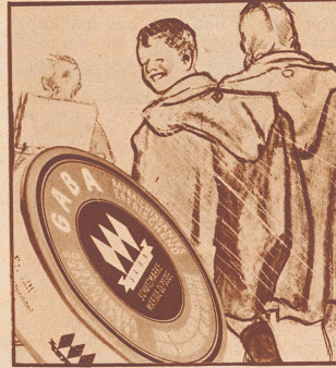
Sie gibt ihm und auch den Kindern jetzt immer Gaba mit. Ob's windet, regnet oder schneit, Gaba schützt vor Heiserkeit.