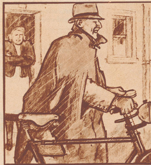
Es tut ihr immer leid, wenn der Mann aus der warmen Stube heraus muß, um ins Geschäft zu fahren. Früher erkälte er sich leicht dabei.