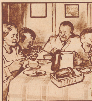
Das Frühstück ist wichtig für die Stimmung des ganzen Tages, denkt Mutter Kägi.

Nord spielt 4 Herz. Ost macht den ersten Stich mit Treff As und spielt zum zweiten Stich klein Pik. Nord-Süd sollen den Kontrakt gegen jede Verteidigung erfüllen. Wie ist zu spielen?