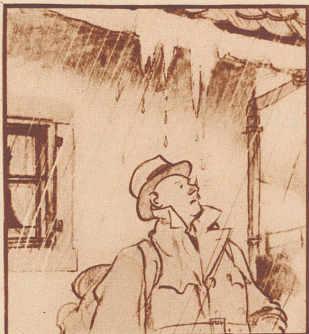
Das nennt man vom Regen in die Traufe kommen. Echtes Hustenwetter!