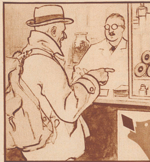
„Ja, in der Stadt sind viele Leute erkältet, da beugt man lieber vor.“