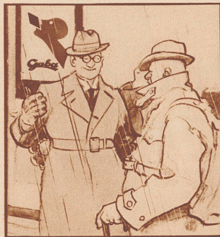
„Hustenwetter? Nein, Gabawetter. Und hier sind Sie an der Quelle.“