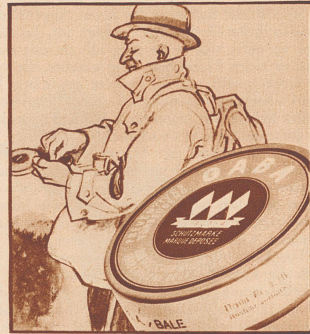
Am besten nimmt man Gaba, schon wenn der Nachbar Husten hat.