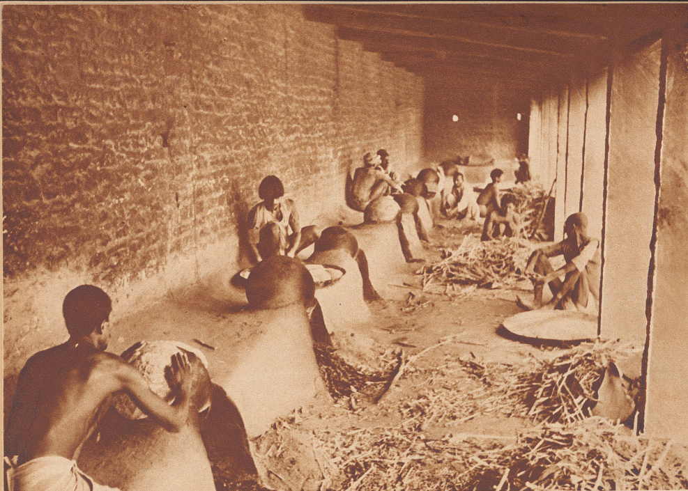
Die Elefantenküche mit den vielen Backöfen, auf denen die Wärter für ihre Schützlinge flache Maisbrote backen.

La cuisine des éléphants. Les puissants potentats des Indes possèdent de véritables troupes d'éléphants qu'ils utilisent comme montures de parade ou de chasse. Ces pachydermes sont logés dans de vastes parcs, clos d'épaisses murailles et ombragés de grands arbres. Une cuisine spéciale leur prépare à certaines occasions des friandises. Ces jours-là, on peut voir les cornacs étalant à pleines mains, sur les conopoles d'argile qui coiffent les fourneaux, la farine de seigle qui cuit, donne une galette sèche, aliment dont raffolent les éléphants.