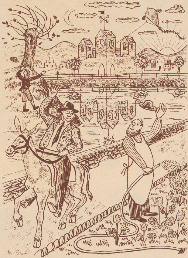
Das Bild der vierzehn Fehler

Wer findet die Unrichtigkeiten heraus, die auf diesem Bild eingezeichnet sind? Lösung in der nächsten Nummer.