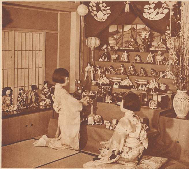
Der Tag der Puppen

In Japan gehört der dritte März den Mädchen. Dort feiert man nämlich einen Puppentag, an dem es sehr festlich zugeht. Alle kleinen Mädchen kleiden sich in ihre blumenbemaalten Sonntagkimonos und bürsten ihre dunklen Pagenköpfchen, bis sie glänzen. Am Morgen schon holen die Mädchen alle ihre Puppen hervor, ziehen auch ihnen die schönsten Kleidli an und spielen mit ihnen bis zum Abend. Einige dieser Puppen stellen verehrungswürdige Persönlichkeiten aus der japanischen Geschichte und aus dem Kaiserhause dar, mit denen man nicht so richtig »bäbele« kann, sondern die man respektvoll behandeln muß. Die Kinder stellen die Puppen der Reihe nach auf und begnügen sich damit, sie anzuschauen.