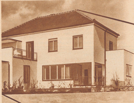
Arch. Fred Traub, Zollikon

Mit einer Feuerstelle das ganze Haus erwärmt und geheizt!