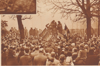
Le 19 mars, au cimetière du Père La-chaise à Paris, les Tchécos défilent aux côtés de la mémoire de leurs morts pour la France pendant la guerre.