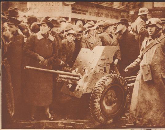
Die Tschechoslowakei ein deutsches Frontkorps Deutsche Truppen haben Böhmen und Mähren besetzt. In Prag wohnt eine schweigende Einwohner-schaft dem Einzug der deutschen Truppen bei.