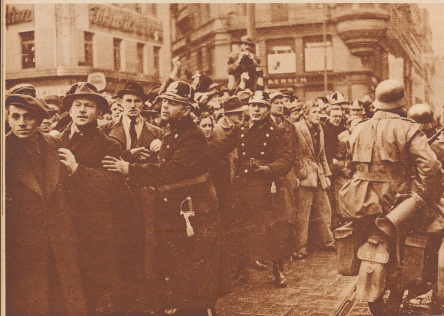
Prag tschechische Bevölkerung beobachtet, von der eigenen Polizei beobachtet und zur Ruhe gebracht, den Einzug der deutschen Truppen in die Stadt.