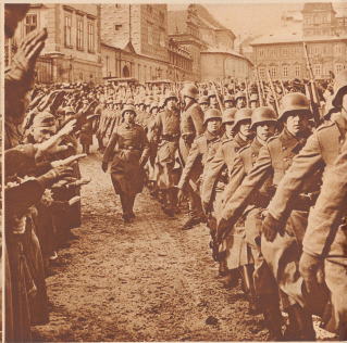
Die deutschen Truppen in Prag, begrüßt von deutschen Einwohnern der Stadt gegenwärtig 90.000 Bewohner, von denen ungefähr 35.000 deutschsprachig.