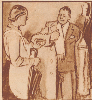
Er: „... Schnupfenwetter!“ Sie: „Nicht so schlimm, vor allem Deine Gaba nicht vergessen, die beugen vor!“