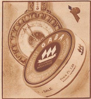
Wie steht der Barometer? Auf Gaba steht er.