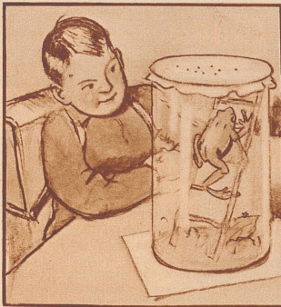
„Ach was, eben sass er noch unten, jetzt oben, was gilt nun?“

«Ob das ein Glück ist, muß man erst abwarten», sagte Lore und legte ihren Kopf an seine Brust.