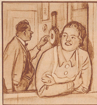
Er: „Wer hat schon wieder den Barometer verstellt?“ Sie: „Niemand, Vati, es ist eben Aprilwetter.“