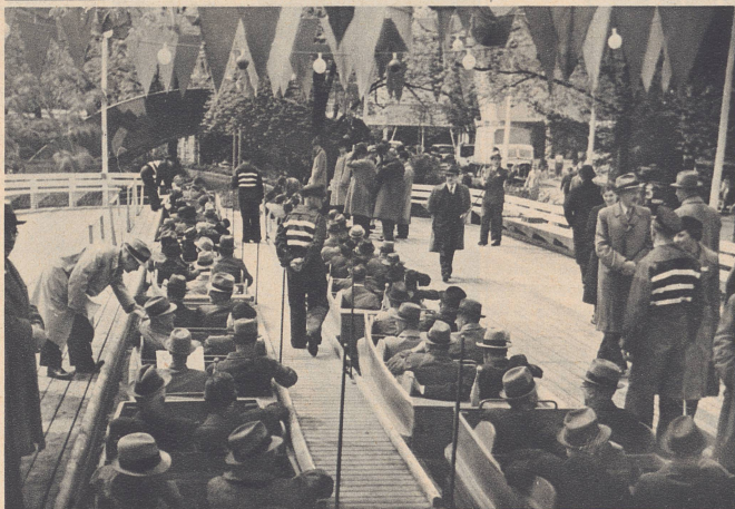
Die Einsteigestation des Schifflibaches. Hier herrscht Bahnhofsbetrieb. Am ersten Ausstellungsontag fuhren zehntausend Menschen den Bach hinunter.