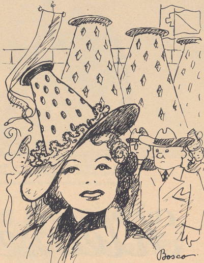
Der neue Sommerhut, Modell Landi