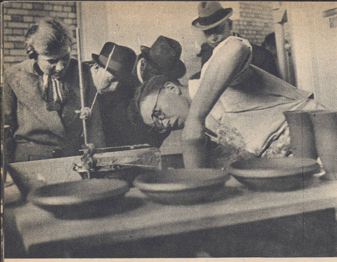
Der Töpfer im keramischen Pavillon der Abteilung Bauen muß bei seinem Handwerk scharf aufpassen, und mitunter müssen sich die Frager gedulden, bis er seine Erklärungen abgeben kann. Er hat im Anfang nur zwei Stunden gebraucht, bis er an das Arbeiten vor dem Publikum gewöhnt war.

«Au bout de deux heures, j'étais habitué au public!» déclare le potier dans la section de la Construction, au pavillon de la Céramique. Aujourd'hui, il ne se laisse plus distraire par des questions... Imprévues.