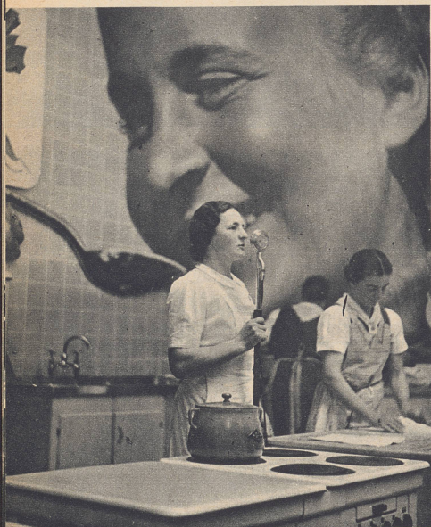
Überall in der Landi wird gekocht: mit Holzfeuerung, mit Gas und — wie auf unserem Bild — mit Elektrizität. Die Erklärungen zu dieser uralten und doch ewig wandelbaren Tätigkeit werden durch Lautsprecher übertragen, denn oft drängen sich die weiblichen Zuschauer, um nur ja neue Rezepte und Kochkunststücke für den häuslichen Tisch zu erfahren.

Vous trouverez les souffleurs de verre un peu partout à l'Exposition, au Gaz, à l'Electricité, à la Chimie. Ne les questionnez pas pendant le travail — quand le verre est chaud les secondes sont précieuses et un moment d'inattention serait funeste!