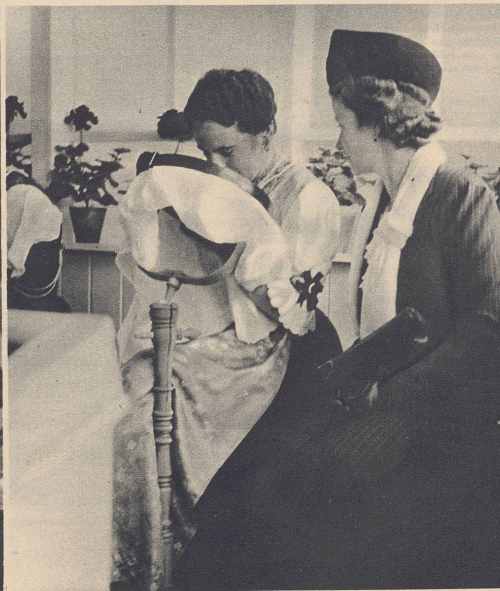
Zu den Appenzeller Handstickerinnen im Pavillon «Kleider machen Leute» zieht es natürlich die Frauen, und wenn einmal ein männlicher Zuschauer eine spöttische Bemerkung macht, so wird er mit völliger Nichtachtung gestraft. Der Stickerin gefällt es gut, stets Publikum zu haben, und war sie anfangs auch durch die ungewohnte Umgebung etwas ermüdet, so möchte sie jetzt am liebsten ihr ganzes Leben lang ihre Handfertigkeit öffentlich zeigen.

Un bon tuyau: pour avoir des recettes de cuisine inédites, écoutez les explications que vous produisent les génies gastronomiques en tablier blanc devant les cuisinières à gaz ou à l'électricité (comme celle de notre photo) ou devant le fourneau-potager. Afin que tout le monde comprenne, il est utile d'avoir un microphone.