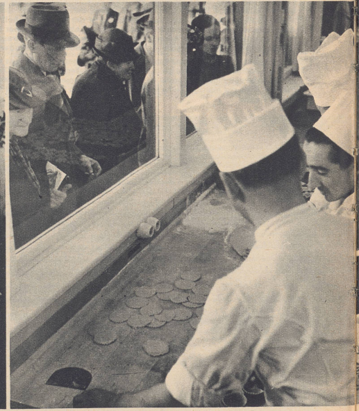
Durch die Fensterscheiben der Konditorei wird den Köchen scharf auf die Finger geschaut, denn natürlich lockt diese Demonstration vor allem die Frauen an, und die sind bekanntlich kritisch, vor allem, wenn sie selber etwas vom Backen verstehen. Den Köchen bleibt nicht viel Zeit, an ihr Publikum zu denken, aber der in der Mitte schaut doch manchmal auf, wenn kein schönes Kind da ist. Und mitunter macht er einen Extraspäß, damit die ernsthaften Zuschauer auch etwas zu lachen haben.