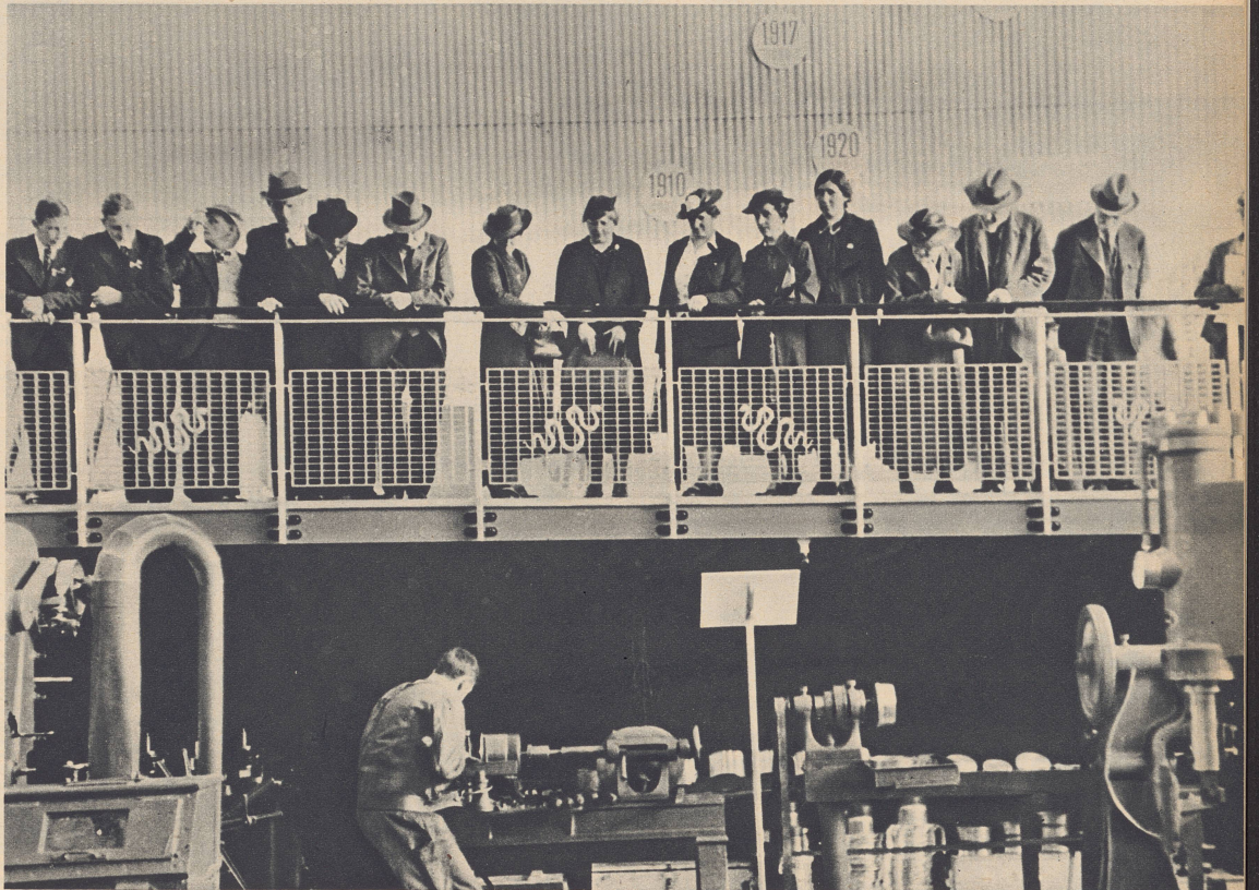
Wie in einem Bärenzwinger befinden sich die Arbeiter in der Halle Aluminium, und staunend sehen die Leute am Gitter zu, wie eine Aluminiumpfanne nach der anderen entsteht, so geschwind, daß selbst die übereifrigsten Hausfrauen im Verbrauch nicht nachkommen könnten. Zuerst störte es den Hersteller, daß er im Blickfeld stets laufende Beine hatte, aber jetzt kennt er es nicht mehr anders, und wenn ihm etwas zugerufen wird, so lacht er hinauf und gibt Auskunft.

C'est une des joies de l'existence en même temps qu'une particularité dont l'Exposition nationale nous offre la primeur. Un peu partout à Riesbach comme à Enge, on assiste à la naissance et au développement des mille et un objets qui nous entourent dans notre vie quotidienne, on participe — du moins des yeux! — à la création des chefs-d'œuvre le plus divers. Ce contact entre ouvriers, artisans, artistes et le public se révèle fertile en incidents joyeux et pittoresques.