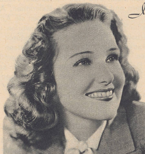
Lola Lane, Star of Warner Bros. Pictures, appearing in "Four Daughters".

Irimum in Pepsodent Zahnpaste begeistert Millionen — jeden Morgen erneut — durch das neue blendende Weiss, das es den Zähnen verleiht! Nie zuvor konnte solch strahlender Glanz mit einer so absolut unschädlichen Zahnpaste erzielt werden. Ja, mit IRIUM-haltigem Pepsodent riskieren Sie nichts . . . keine Möglichkeit, dass Ihr kostbarer Zahnschmelz angegriffen wird.