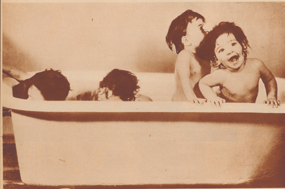
Das schöne Vergnügen der Tage: das Bad zu Baden, in dem man die schönsten Spiele und Plaudereien veranstalten kann.