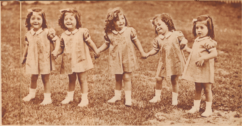
Oh je jennal Langezeit im Freizeitspaß, wenn man sich im Freizeitspaß nicht mit dem Spiel, sich an der Hand zu lassen und so zu marschieren oder zu tanzen!