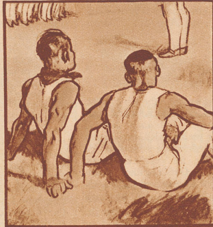
„Fabelhaft, diese flotte, präzise Zusammenarbeit! In unserer Riege klappt es nicht immer so.“