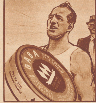
Das stimmt, der weiss, was ihm hilft. Er nimmt täglich Gaba, das hält die Stimme rein und klar.