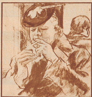
„Ich finde nur Cigaretten chic!“