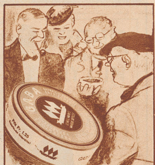
„O nein! Davor schützt Gaba!“ Jeder Raucher Gaba-Verbraucher!