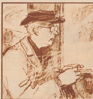
„Sie werden bestimmt noch alle heiser von dem Rauch.“