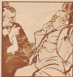
„Mir geht nichts über meine Pfeife.“ „Unbegreiflich! Ein guter Stumpfen ist doch rassist!“

In allen Provinzen erhebt sich das Volk, und so verarmt und dezimiert die Bevölkerung durch die unzähligen Kriege auch ist, es greift mit Todesverachtung nach Flinten, Pistolen, Messern und Sensen; Männer und Frauen, einerlei welchen Standes sie sind, kämpfen um jeden Fußbreit Boden, um die Freiheit zurückzuerlangen. Der gewaltige Aufschwung hätte vielleicht das Land gerettet, wenn die Bauern und die untere Stadtbevölkerung nicht zugleich die revolutionären Forderungen, die