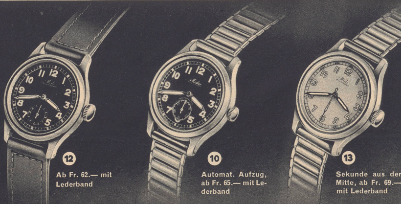
12 Ab Fr. 62.— mit Lederband