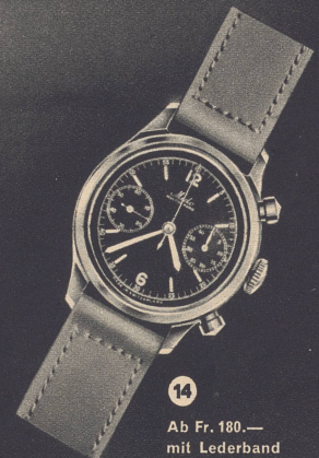
14 Ab Fr. 180.— mit Lederband

Modell Nr. 10 ist ferner mit dem automatischen Aufzug ausgerüstet. Diese Uhr wird durch die natürlichen Armbewegungen aufgezogen und hat nach 3–5stündigem Tragen eine Gangreserve von ca. 32 Stunden.