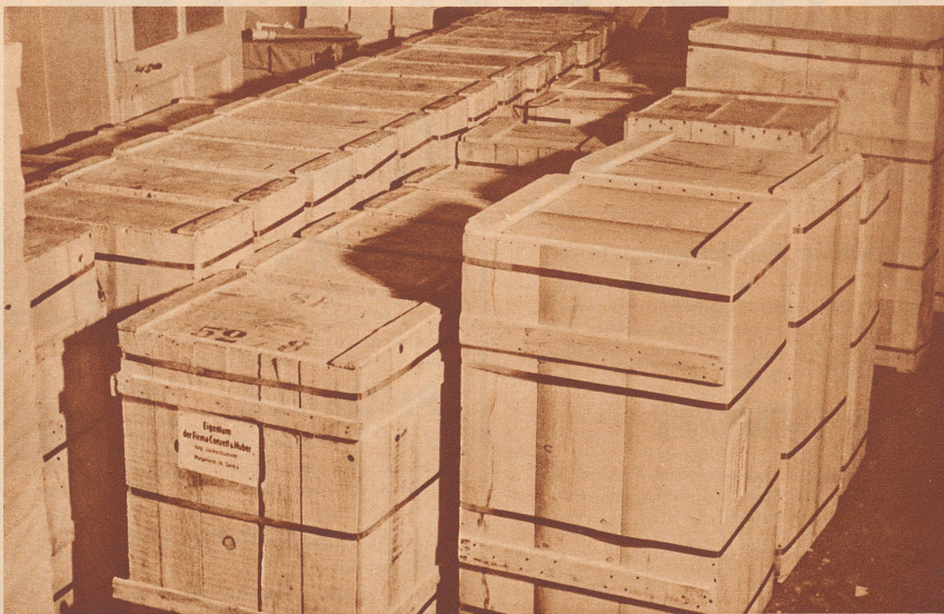
Ein Teil der in Kisten verpackten Wanderatlanten, bereit zur Uebergabe an das Militärkommando.

Laut Befehl des Armeekommandos mußten sämtliche topographischen Karten, Touristenkarten, Wanderatlanten, Stadtpläne etc. restlos dem Kommandostab abgeliefert werden, der sie bis zur Beendigung der Mobilisation in strenger Verwahrung hält. Dieser Maßnahme mußten sich alle Firmen, die entweder Karten selbst herstellen oder in Depot haben, unverzüglich unterwerfen, und so sind auch viele Tausende von Wanderatlanten, die wir für unsere treuen Abonnenten hergestellt hatten, der Armee in Obhut übergeben worden.