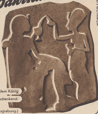
Königin dem König Bier einschenkend. (Aus einer Ausgrabung.)