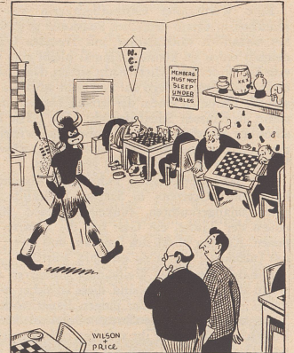
Hier kommt ihr Gegner; ich hoffe, er ist kein unangenehmer Verlierer. (Aus «Chess»)

wandert bis nach b4, nachdem er alle Bauern auf dunkle Felder gestellt hat und opfert nachträglich den Turm auf b3. Der Textzug beschleunigt den Untergang. 34. .. Td2×a2, 35. Kg1-g2, Kf8-e7 36. g3-g4, f7-f6 37. h2-h4, Ke7-d6 38. Kg2-g3, Ta2-b2 39. f2-f4, a7-a5 40. g4-g5, Kd6-c5, 41. Lc4-g8, Kc5-b4 42. f4-f5, Tb2×b3! 43. Lg8×b3, Kb4×b3 44. h4-h5, h7-h6! Bricht jeder Spekulation die Spitze. Es drohte h5-h6, g×h6, g5-g6 und Weiß bekäme rechtzeitig eine neue Dame mit Schachgebot. Nach dem Textzug gab Weiß auf. Diese Partie ist ein besonders schönes Beispiel klarer Spielführung und präziser Ausnutzung der kleinsten gegnerischen Unterlassungen.