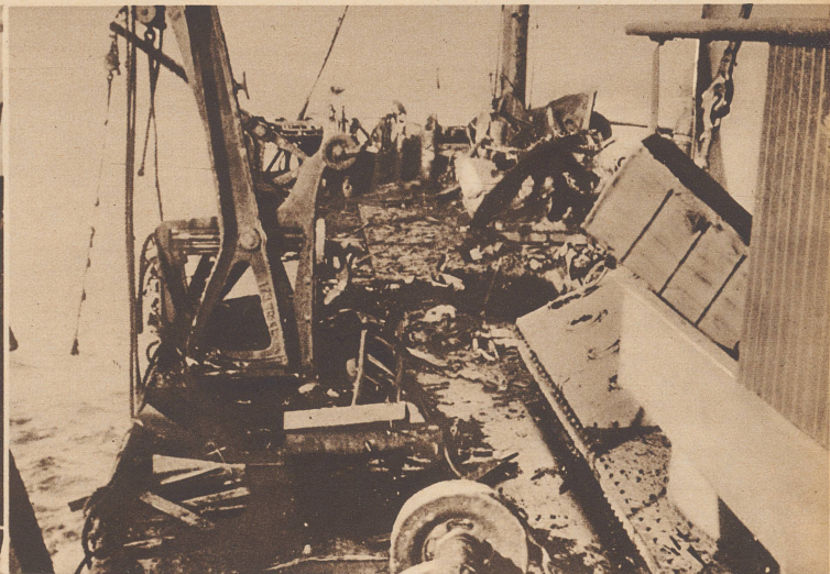
Die Wirkung. Eine deutsche Fliegerbombe traf das Hinterdeck des französischen Frachtdampfers «Reculver». Außer dem schweren Materialschaden gab es einen Toten und 32 Verletzte. L'effet d'une bombe allemande sur la poupe du cargo français «Reculver». En plus des gros dommages matériels, un matelot trouva la mort et 32 furent blessés par le projectile.

Une tâche périlleuse. Voici, à bord d'un poseur de mines anglais chargé de la préparation d'un champ de mines, des centaines de mines marines prêtes à être descendues dans la mer.