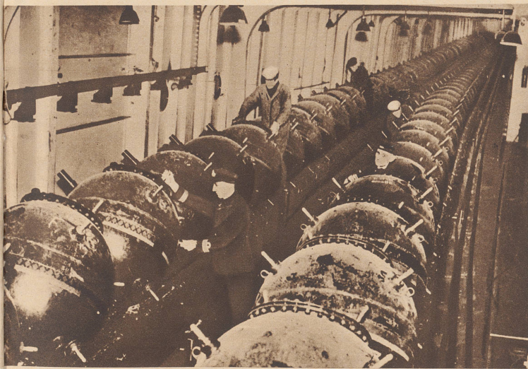
... und aufgereiht wie Perlen an der Schnur! Die Vorräte an Bord eines englischen Minenlegers, der den Auftrag hat, auf See, an einer Stelle vor Englands Küste, ein Sperr-Minenfeld zu legen.

Une tâche périlleuse. Voici, à bord d'un poseur de mines anglais chargé de la préparation d'un champ de mines, des centaines de mines marines prêtes à être descendues dans la mer.