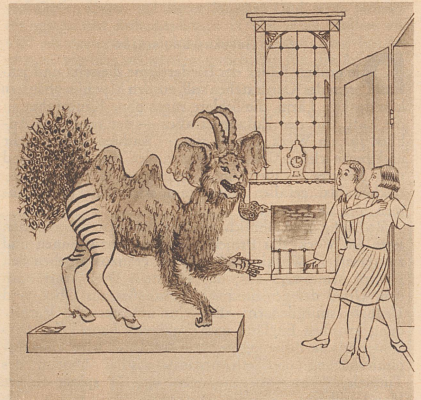
Gemeines Lügentier (chimaera vulgaris) Das gemeine Lügentier besteht aus acht verschiedenen Tiertellen. Sind die Namen der acht in Wirklichkeit vorkommenden Tiere gefunden, so ist dem Lügentier seine erschreckende Wirkung genommen.

Ein grausiges Ungetüm starrte sie an. Noch nie hatten sie dergleichen gesehen, und fast wären sie vor Entsetzen umgefallen. Doch das Untier blieb reglos, und so atmete Otto auf und begann zu hoffen, es könnte ausgestopft sein. Und wirklich, so war es auch. Er trat kühn näher und entdeckte ein Täfelchen, auf dem geschrieben stand: