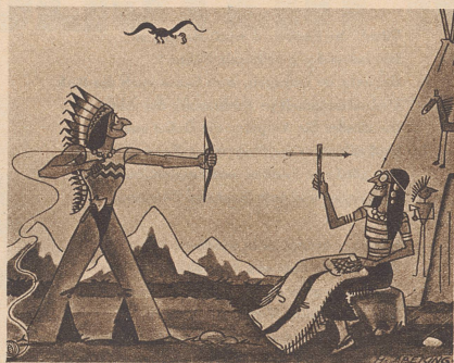
Der Indianer fädelt seiner Frau die Nadel ein. Entr'aide conjugale chez les Indiens. (Die Woche)

Un de nos plus célèbres hommes politiques était allé consulter un grand spécialiste sur son état général qui lui donnait quelque inquiétude. Après l'avoir soigneusement ausculté, le docteur lui dit: — Rassurez-vous, cher ami. Rien de grave. Aucun organe essentiel n'est atteint. Le cœur fonctionne à merveille. — Oh!... dit le grand homme, il a si peu servi!