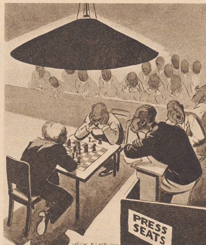
Der Zeitungsreporter: «Und um diesen Bericht zu schreiben, habe ich Stenographie lernen müssen.» Le reporter: — Dire que j'ai appris la sténographie!