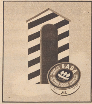
Gaba nehmen — Gaba nützt, Gaba schicken — Gaba schützt!

Lärm ruiniert die Nerven dieses gehetzten, lärmgequälten Mannes. Ihm helfen aber sofort bei Tag und Nacht OHROPAX-Geräuschschützer, ins Ohr gesteckt, weiche, formbare Kugeln zum Abschließen des Gehörganges. Sch. mit 6 Paar Fr. 2,70 in Apoth., Drogerien, Sanitätsgesch.