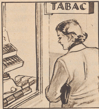
Gleich am nächsten Sonntag soll er ein Päckli haben. „Wenn ich nur wüsste, was er mag: Cigaretten, Stumpen oder Tabak?“