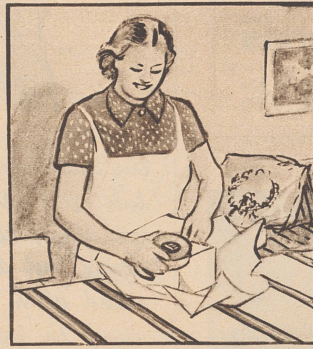
„Von jedem etwas, Und dazu eine grosse Schachtel Gaba, die ist so wieso recht.“