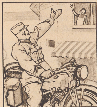
Die beiden kennen sich noch nicht lang — aber es hat doch einen ausführlichen Abschied gegeben, als er einrückte.

«Entschieden. Diese Auslandsreise erhöhte zweifellos die Nerven- und Geistesspannung, unter der diese