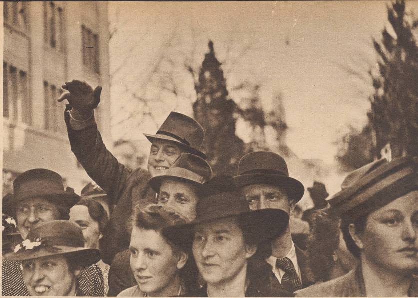
«Trudeli, chumm, da bin ich!» «Petite Trudi, viens, je suis là.»