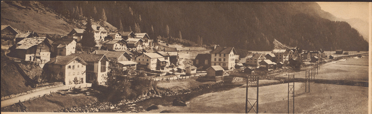
Der Pfarrweiler Roffna mit seinen hübschen Villen, der in Graubünden liegt, im Oberhalbstein, am Fuße des Piz d'Err. Roffna est situé dans les Grisons au pied du Piz d'Err, à mi-chemin entre Coire et St-Moritz.

Behördlich bewilligt am 23. V. 40, gem. 50 BRB. vom 3. X. 30