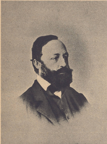
Gottfried Keller ums Jahr 1860. Ein vierzigjähriger Mann ist er hier. Seit etwa fünf Jahren lebt er nach siebenjähriger Abwesenheit wieder in Zürich. Zwei Bändchen Gedichte sind von ihm erschienen, ebenso das große Werk des «Grünen Heinrich» in der ersten Fassung und der erste Band der «Leute von Seldwyla». — Er steht kurz vor seiner Wahl zum Staatsschreiber, ohne aber an ein solches Amt zur Zeit zu denken oder so etwas zu wollen.

Züge eines charakterstarken Mannes, dem freilich das landläufige Menschenglück nie gelächelt hat, dem jede Lebensfreude nur über einer stillen Grundtrauer erblühte, der schon in Knabentagen Schiffbruch erlitt, in Jünglingsjahren große künstlerische Hoffnungen begrub, im Mannesalter jeden Erfolg sich schmerzlich erkämpfen mußte, dem niemals Frauenliebe erfüllend zuteil wurde, an dessen trotziger Art selbst manche Freundschaft zerbrach und der doch in allem Ungemach sich nie verhärtet hat und eine große Menschenliebe still verschlossen mit sich trug.»