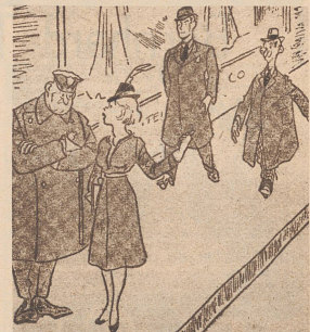
«Entschuldigen Sie, Herr Polizist, diese zwei Männer verfolgen mich ständig; könnten Sie nicht den kleinen davon abhängen?» — Pardon, Monsieur l'agent, ces deux hommes me suivent avec insistance, ne pourriez-vous me débarrasser du plus petit? (Colliers, USA.)