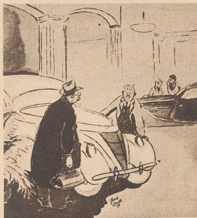
Arzt zum Autohändler: «Kann ich Ihnen vielleicht als Anzahlung den Blinddarm herausnehmen?» ...et comme acompte, je pourrais peut-être vous débarrasser de votre appendicite? (Passing Show, London.)