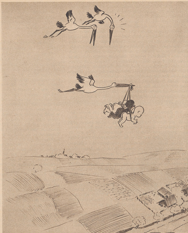
«Die Frau wird Augen machen, den Neger hat sie als Zugabe gekriegt.» — Elle va en faire une tête, la dame! Le petit nègre est par-dessus le marché!

Theo wollte sich scheiden lassen. «Wie wollen Sie diese Absicht begründen?» fragte sein Anwalt. «Meine Frau treibt sich Abend für Abend in Kneipen umher.» «Was tut sie denn da?» «Sie sucht mich.»