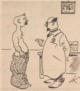
«Ständiges tiefes Atmen bringt die Bazillen zum Absterben!» «Aber wie bringe ich die Viecher zum tiefen Atmen, Herr Doktor?» — En respirant profondément, cela tue les bacilles! — Alors, docteur, comment puis-je faire respirer les bacilles?