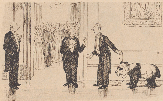
«Die Einladung lautete: „Einen Freund mitbringen...“ «Es ist mein einziger Freund!» — L'invitation mentionnait... prière d'amener un ami! — Eh! bien, c'est mon unique ami!