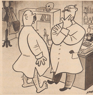
Arzt: «Sie müßten täglich mindestens drei Stunden spazierengehen!» Briefträger: «Vor oder nach der Arbeit?» Le médecin: — Alors, mon ami, je vous recommande de faire chaque jour une promenade de trois heures, au minimum. Le facteur: — Avant ou après mon travail, docteur?