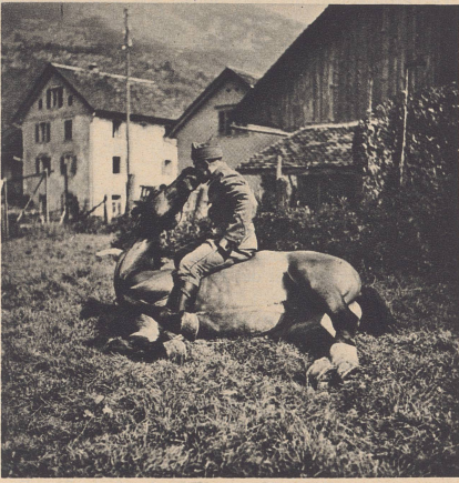
«Hans» legt sich auf Befehl nieder und erhält in dieser Lage einen Zucker aus dem Munde seines Meisters.