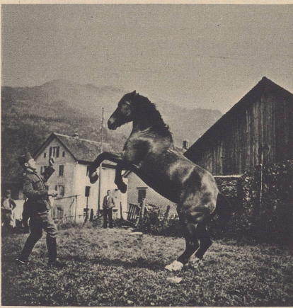
«Hans» zeigt auf Befehl eine schöne Levade.