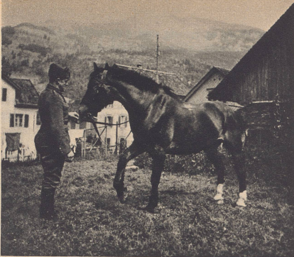
«Hans» gibt auf Verlangen den Fuß — er weiß ganz genau, ob der rechte oder der linke verlangt wird.