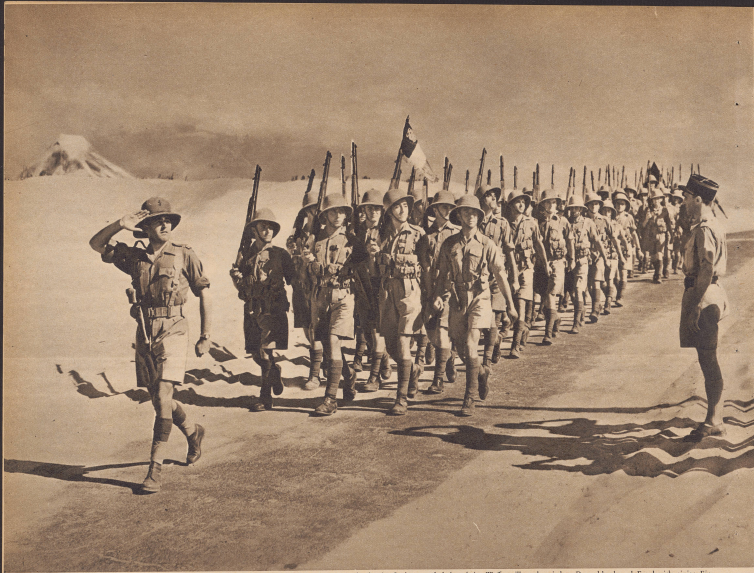
Von der großen französischen Leeresarmee, die bis zur Niederlage der Mutterlande in Syrien stand, haben beim Waffenstillstand zwischen Deutschland und Frankreich einige Einheiten sich der Bewegung des Generals de Gaulle angeschlossen und kämpfen nun auf den afrikanischen Kriegsschauplätzen mit den Engländern gegen die Italiener. Bild: Delle, einer kleinen französischen Abteilung, die ebenfalls in Syrien stand und nun in der Operation General Wavell kämpft. Die Truppen unterstehen wohl dem Oberkommando Wavell, haben aber ihre eigenen subalternen Offiziere, bilden eigene Formationen und werden von den Engländern ausgerüstet.