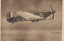
Eine englische Hurricane-Jagdmaschine auf Patrouillenflug über dem Sandmeer der Libyschen Wüste. Gegen das Eindringen von Sand und Staub sind diese Apparate mit einer besonders guten Verkleidung versehen.