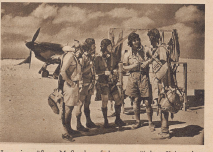
In weit größerem Maße als auf den europäischen Kriegsschauplätzen spielt die Luftwaffe in Afrika eine entscheidende Rolle. Mehrstündige und ruhende Kolonnen finden im Wüstenfeld keine Deckung und sind schutzlos dem Bombenregen der Flieger ausgesetzt. Bild: Englische Piloten auf einem Stützpunkt in der wüstenhaften Umgebung einer Kampflinie.