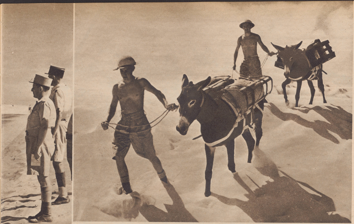
Die schwierigen Nachschubprobleme im Wüstenkrieg. Bis weit über die Hüfte sinken die Maultiere auf ihrem Marsch nach vorne in Sand ein. Dazu beschwert hier eine Temperatur von über 30 Grad über Null. Entsprechend sind die Stämmersoldaten auch leicht gekleidet.