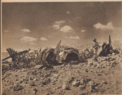
Die Überreste eines zwischen Sidi Barrani und Marsa Matruh abgeschossenen italienischen Bombers.