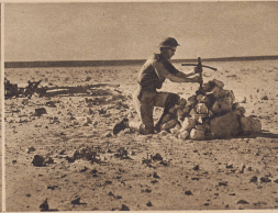
Das Wintergerät für die fünfköpfige Besatzung eines abge-schossenen italienischen Bombers. Das Kreuz ist aus Trümmern des verbrannten Flugzeuges hergestellt.