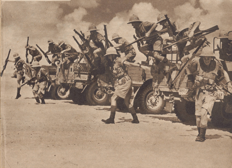
Stellungsbewegung einer motorisierten Einheit der freien französischen Truppen auf dem englisch-italienischen Kriegsschauplatz in Nordafrika.