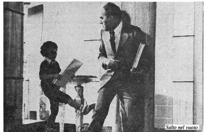
Salto nel vuoto

In «Salto nel vuoto» ist von Bellocchios geliebt-gehasstem Thema der «Familie» nur noch ein Torso – das Geschwisterpaar – übrig. Der Konflikt der beiden ist der Konflikt jeder Paarbeziehung: gegen- oder einseitige Abhängigkeit, Angst vor der Freiheit, die Alleinsein bedeutet, die Ausnützung des Partners, die Diskriminierung vor allem der Partnerin. Wer da allerdings am schiefen Gleichgewicht schuld ist, wer eigentlich der Schwächere und zum selbständigen Leben Unfähige ist, macht dieses Werk auf hintergründige und eindrückliche Weise deutlich. Ein Thriller mit umgekehrten Vorzeichen!