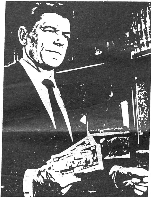
Ronald Reagan in The Killers